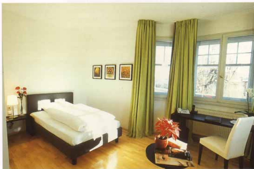
Zeitlose Eleganz prägt die von den Innenarchitektinnen gestalteten Hotelzimmer.

Im Souterrain befindet sich der Kreativbereich mit einer großen gemütlichen Wohn-