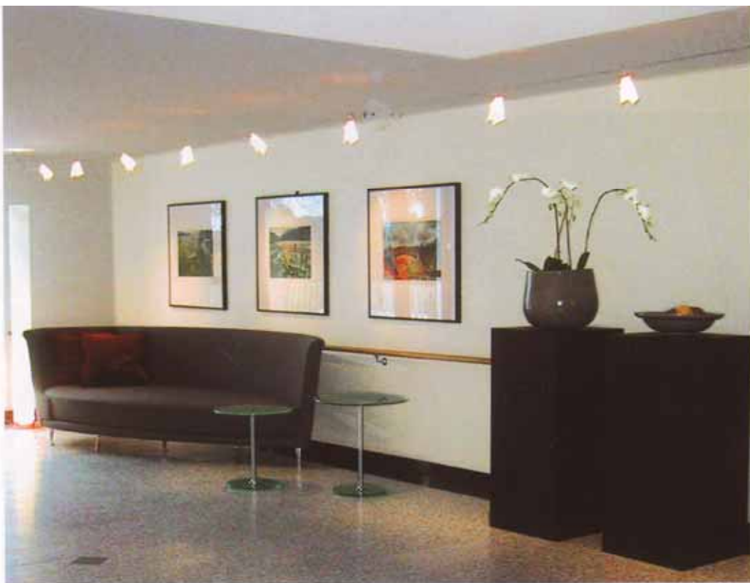
Das Foyer der Wohnanlage mit den Ingo-Maurer-Leuchten entspricht im Stil der Empfangshalle von Hotel und Restaurant.

zeigen, in welchem Bereich man sich gerade befindet – beispielsweise sind die Orientierungsschilder im Hotel rot, im Wohnbereich dagegen bunt angelegt. Auch beim Pflegestützpunkt im Erdgeschoss des mittleren Gebäudeteils wird die elegante Gestaltung des Empfangs- und Hotelbereichs wieder aufgegriffen. Hier sorgen unter anderem blaue Teppichböden in den Fluren für ein