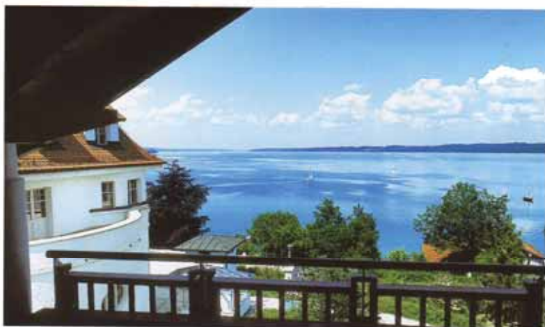
Blick vom Balkon einer Wohnung über den Starnberger See

Der Wellness-Bereich im Untergeschoss mit Schwimmbad, Sauna, Dampfbad und kassenzugelassener Praxis steht sowohl den Bewohnern der Residenz als auch den Hotelgästen zur Verfügung. Von hier aus erreicht man über den »Galeriegang« die Wohnanlage. Dieser Verbindungsflur ist als Rampe mit leichtem Gefälle ausgebildet. Farbliche Akzente an den Decken und Wänden, hohe schlanke Stehleuchten sowie moderne filzbezogene Sitzbänke, die als kleine Rastplätze dienen, schaffen eine einladende Atmo-