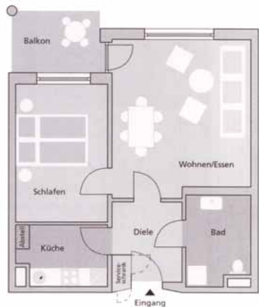
Grundriss einer 2-Zimmer-Wohnung

Seeresidenz Alte Post Betriebs-GmbH Alter Postplatz 1 82402 Seeshaupt Tel: 0 88 01-9 14-0 Fax: 0 88 01-91 32 10 E-mail: info@seeresidenz-alte-post.de www.seeresidenz-alte-post.de